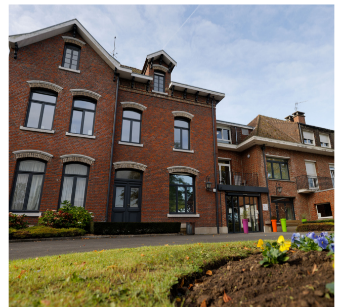
CLINIQUE SAINT-ROCH MARCHIENNES