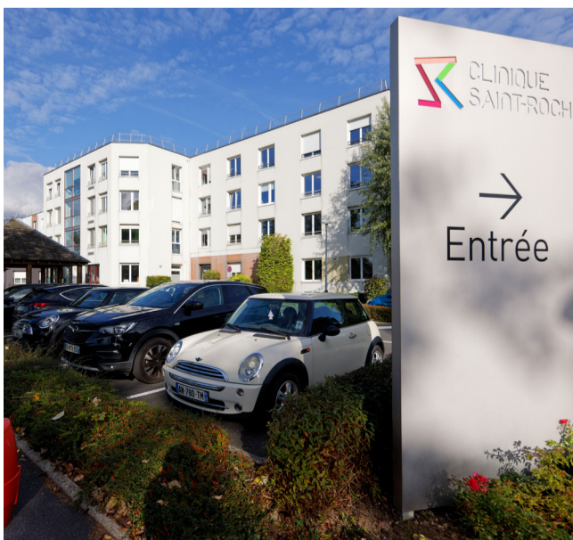
CLINIQUE SAINT-ROCH CAMBRAI