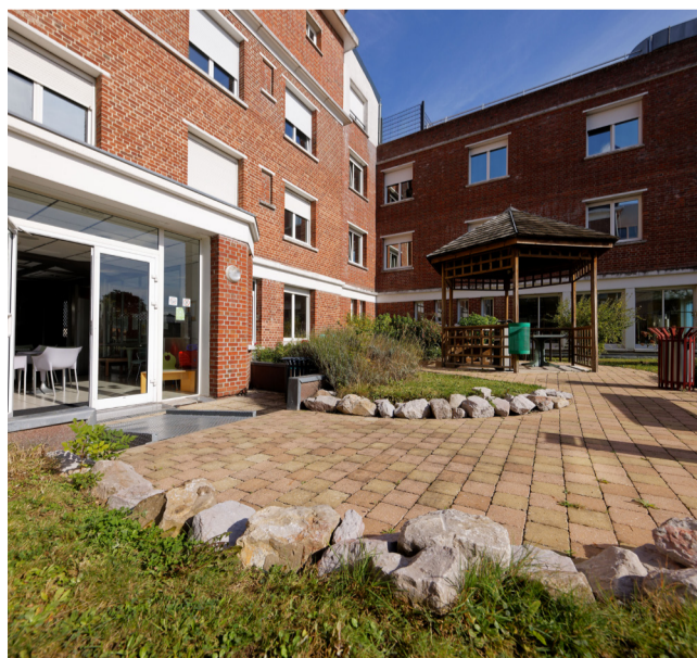
CLINIQUE SAINT-ROCH DENAIN